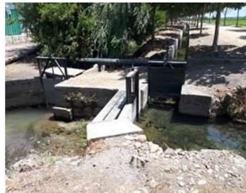
Foto 3. Canal Dren Borghino.