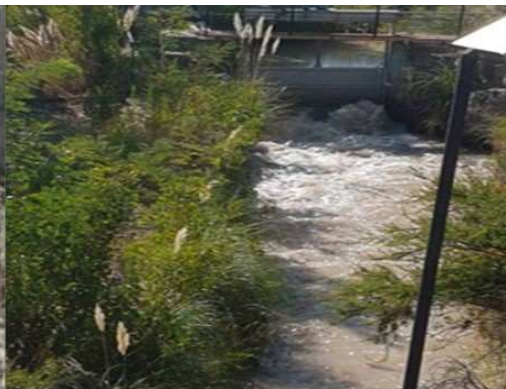
Foto 2. Canal Ahumada.