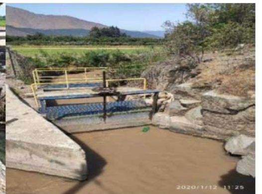
Foto 4. Canal La Sombra.