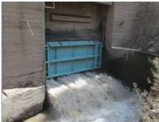
Foto 1. Canal Chacabuquito-Polcaipo.