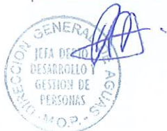
RODRIGO SANHUEZA BRAVO Director General de Aguas Ministerio de Obras Públicas