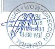
RODRIGO SANHUEZA BRAVO Director General de Aguas Ministerio de Obras Públicas