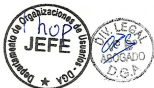
RODRIGO SANHUEZA BRAVO Director General de Aguas Ministerio de Obras Públicas