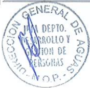
RODRIGO SANHUEZA BRAVO Director General de Aguas Ministerio de Obras Públicas