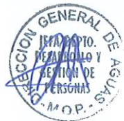
RODRIGO SANHUEZA BRAVO Director General de Aguas Ministerio de Obras Públicas