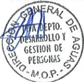
RODRIGO SANHUEZA BRAVO Director General de Aguas Ministerio de Obras Públicas