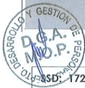
RODRIGO SANHUEZA BRAVO Director General de Aguas Ministerio de Obras Públicas