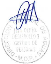
RODRIGO SANHUEZA BRAVO Director General de Aguas Ministerio de Obras Públicas