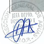
RODRIGO SANHUEZA BRAVO Director General de Aguas Ministerio de Obras Públicas