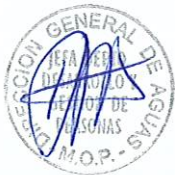
RODRIGO SANHUEZA BRAVO Director General de Aguas Ministerio de Obras Públicas