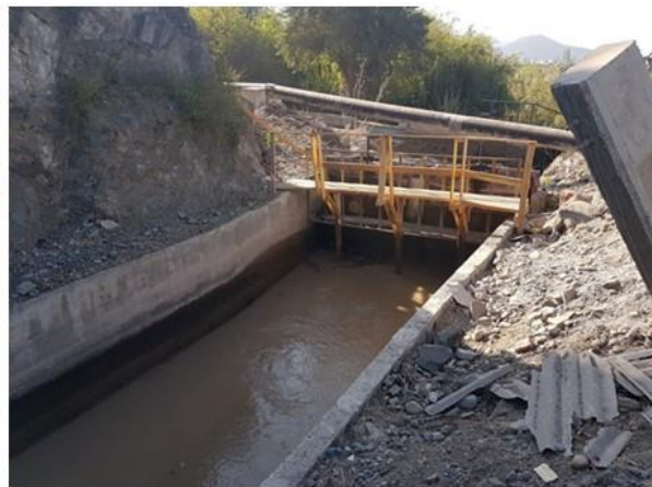
Foto 2. Canal Quilpué.