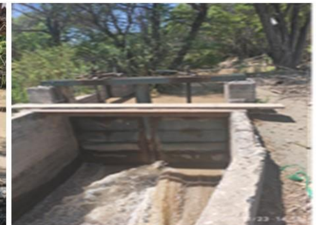
Foto 4. Canal Comunidad Panquehue.