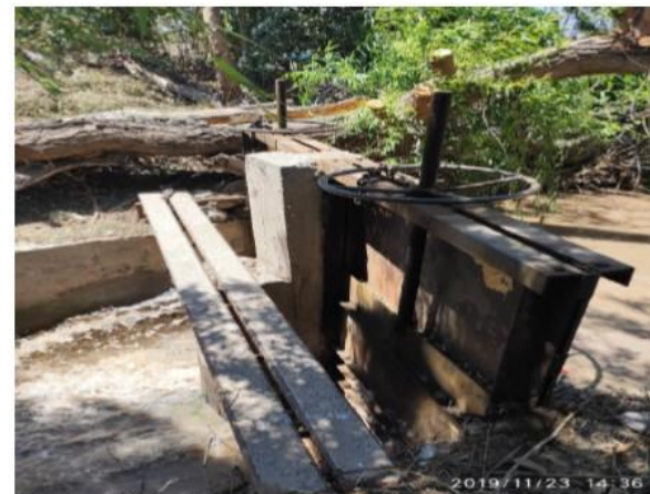
Foto 3. Canal El Cerro.