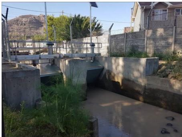
Foto 1. Canal Rinconada.