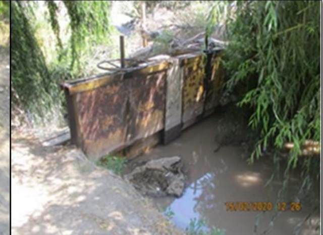
Foto 4. Canal Comunero.