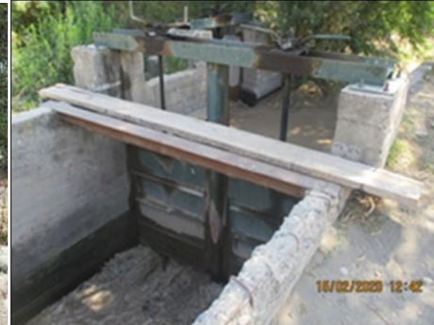
Foto 3. Canal Comunidad de Panquehue.