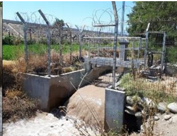
Foto 2. Canal Herrera.