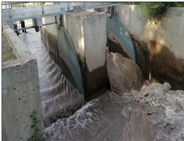
Foto 1. Canal Rinconada.